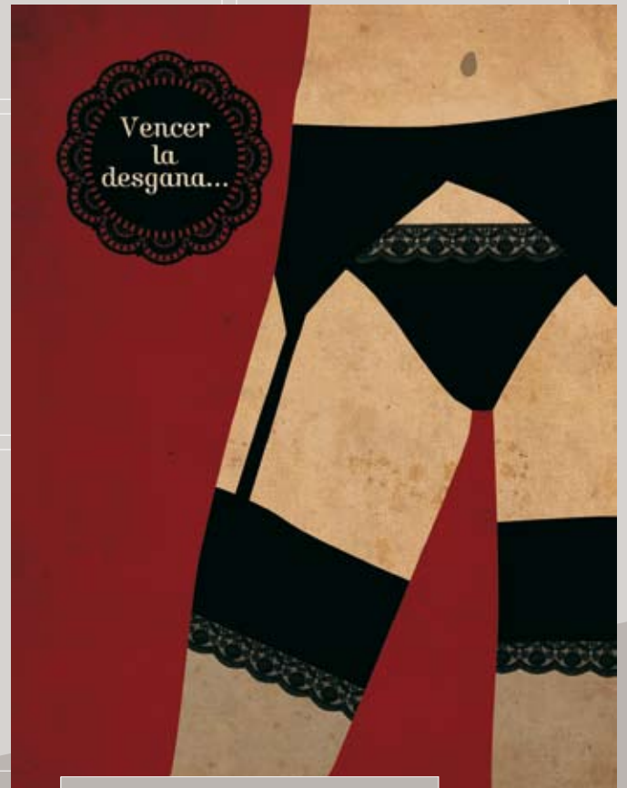
VENCER LA DESGANA: Ilustración para la revista Love in Style de La Maleta Roja.