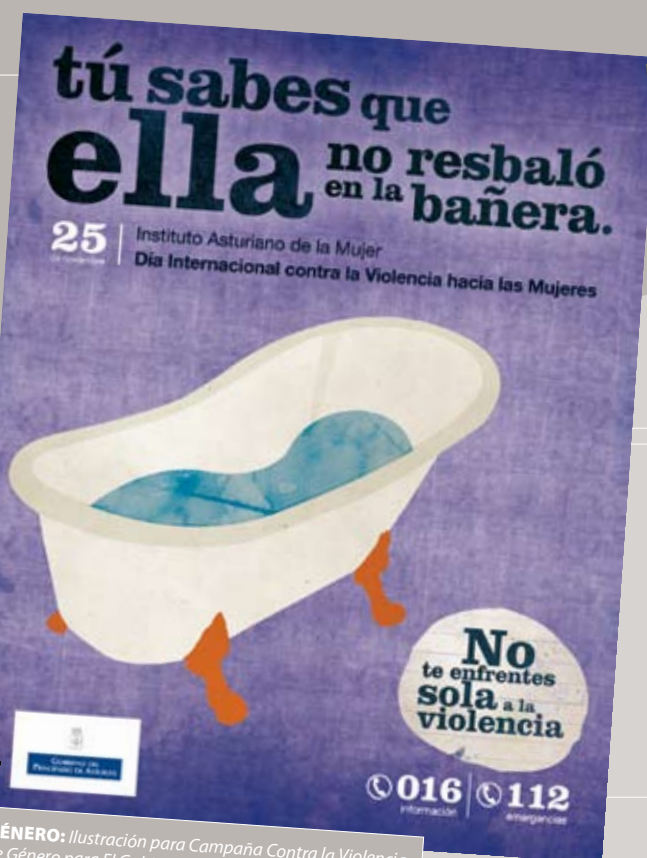
GÉNERO: Ilustración para Campaña Contra la Violencia de Género para El Gobierno del Principado de Asturias.