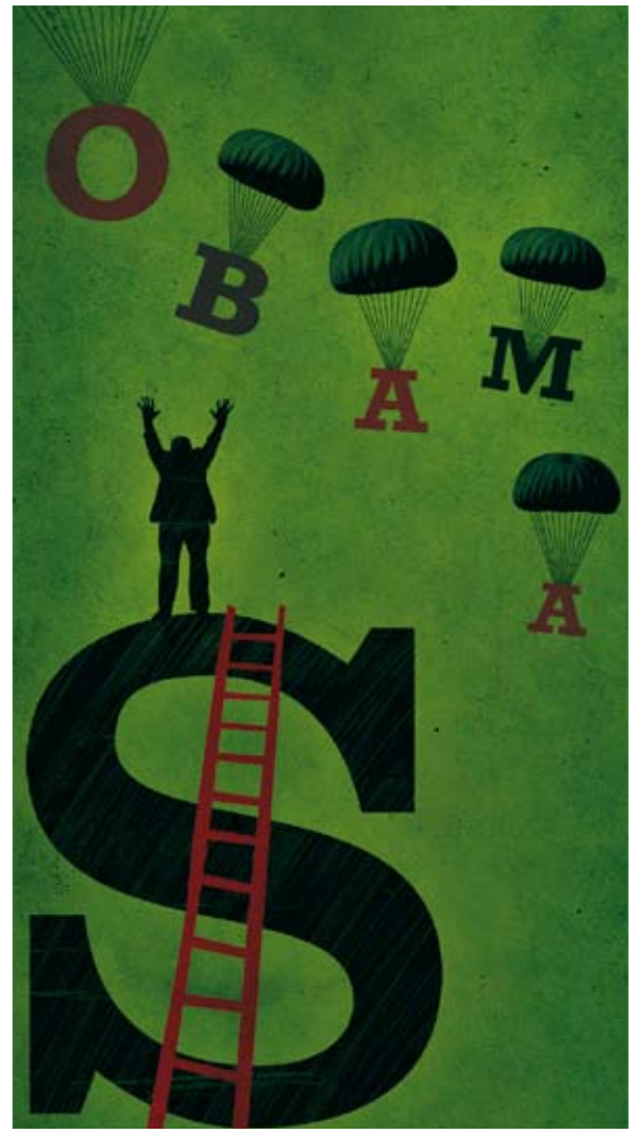
OBAMA: Ilustración para el Suplemento de Economía, de El Mundo.