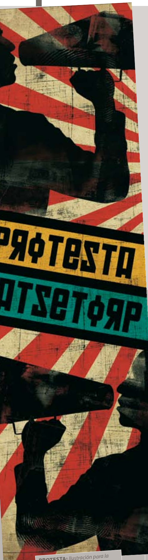
PROTESTA: Ilustración para la Portada del Suplemento Universitario Campus, de El Mundo.

Entre sus futuros proyectos se encuentra una serie limitada de serigrafías en lienzo, una pequeña exposición, un viaje a Bogotá y lo que surja... Me encantaría vivir en el extranjero unos años.