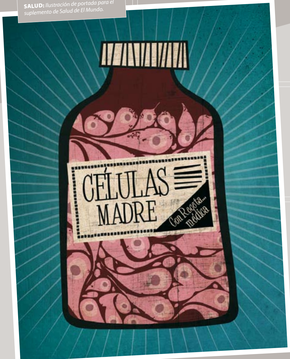
SALUD: Ilustración de portada para el suplemento de Salud de El Mundo.