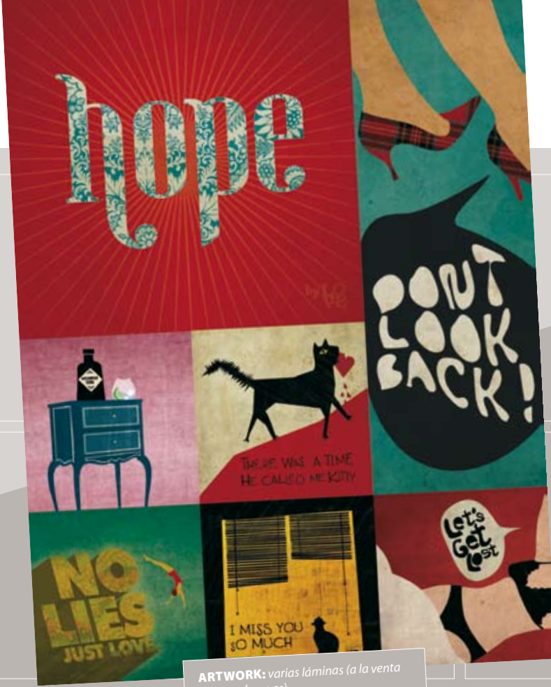
ARTWORK: varias láminas (a la venta en www.lov-e.es )